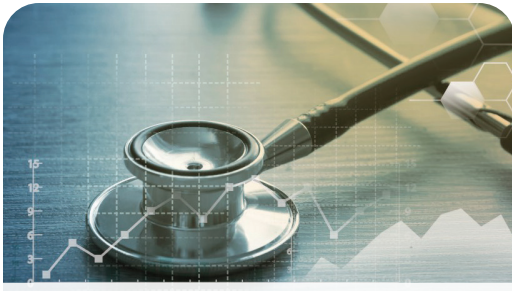
Dollars and Sense Page 3