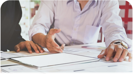
Prioridades estratégicas Página 8