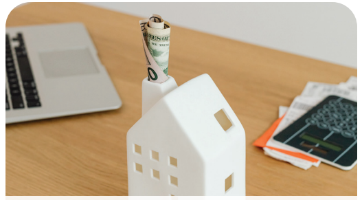
Investing in Healthcare Page 4