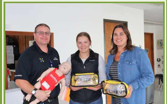
Imagen (de izquierda a derecha)

El MCHD ha comenzado a distribuir estos dispositivos a bomberos, policía, escuelas y lugares donde previamente hemos colocado un DEA. Para obtener más información sobre LifeVac, visite su sitio web en https://lifevac.net/