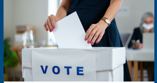
Preguntas y respuestas sobre impuestos Página 3

Edición XII Edición especial, otoño 2023