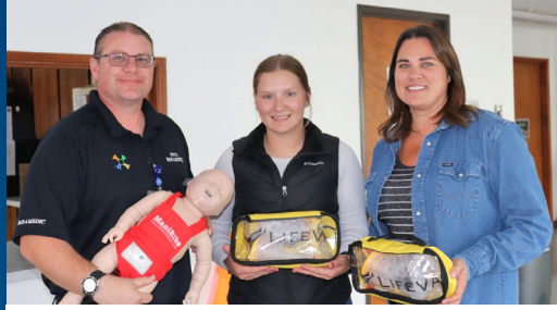
Kits LifeVac en todo el condado Página 3