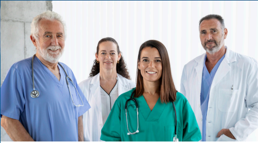
¿Por qué necesitamos un distrito de salud? Página 2